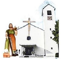
St. Josef Rappenbügl