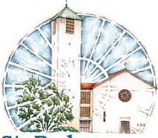
St. Barbara Maxhütte-Haidhof