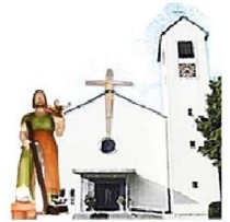
St. Josef Rappenburgl

18.05.2024 bis 23.06.2024 Pfarreiengemeinschaft Maxhütte-Haidhof/Rappenburgl